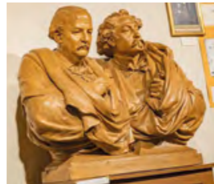
Buste de Bartholdi

Sans compter les 8,5 millions de livres publiés du « Tour de la France par deux enfants ».