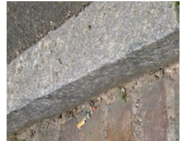
Bordure en granit