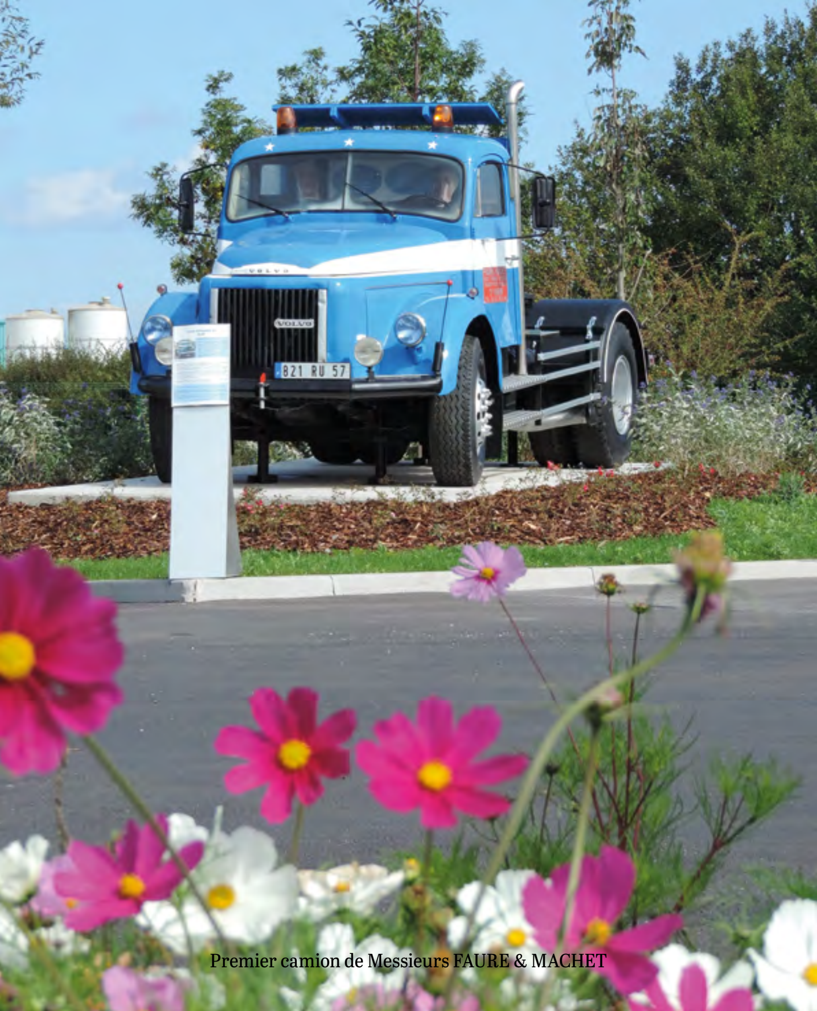
Premier camion de Messieurs FAURE & MACHET