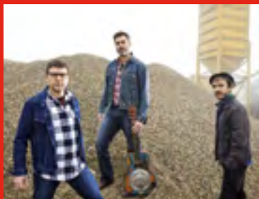
◀Mardi 25/07 La French Vapeur (Folk Rock en français)