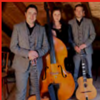
◀Dimanche 23/07 Mundo Swing (Jazz Manouche)