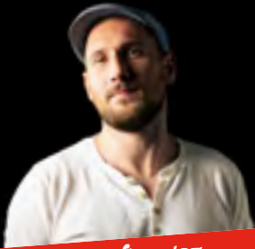
•Mercredi 26/07 Julien m'a dit (bansons)