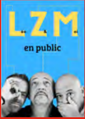
•Vendredi 28/07 LZM (Rock français)