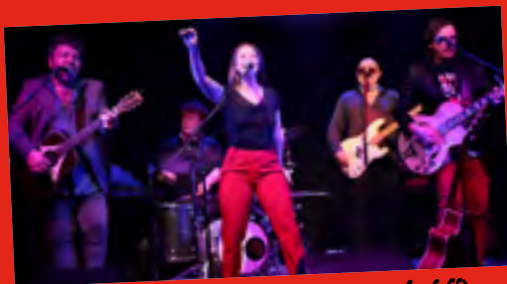
◀Vendredi 21/07 AD'LINE (pop, rock, folk)

POUR CETTE ÉDITION 2023, LA PROGRAMMATION MUSICALE S'EST FAITE EN COLLABORATION AVEC LE CAFÉ CULTUREL "LE COTYLÉDON" QUI PROPOSE DEPUIS 6 ANS À PHALSBURG, À DEUX PAS DE LA PLACE D'ARMES, DES ÉVÉNEMENTS CULTURELS RÉGULIERS ET EN PARTICULIER DES SOIRÉES CONCERTS.