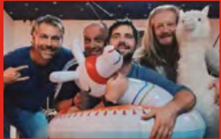
•Dimanche 30/07 Fairway (Rock-Covers)