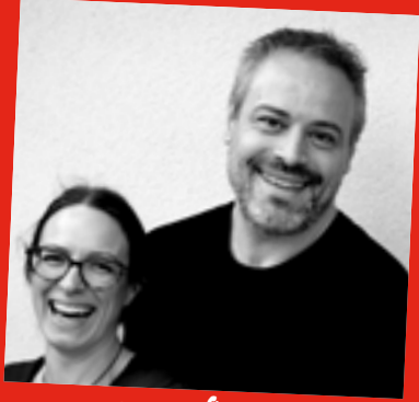
•Mercredi 26/07 Lo-Bau (Rock-Wave)