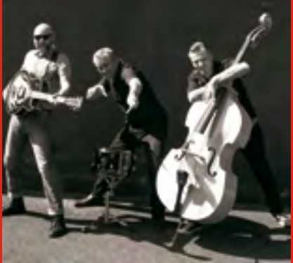
•Jeudi 27/07 Zombie Jamboree (Rockabilly)