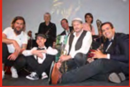
•Samedi 29/07 Ericson's Band (Jazz, New Orléans Band)