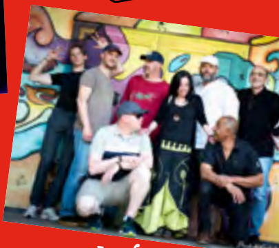
◀Lundi 24/07 Funky Twister (Funk, Soul-covers)